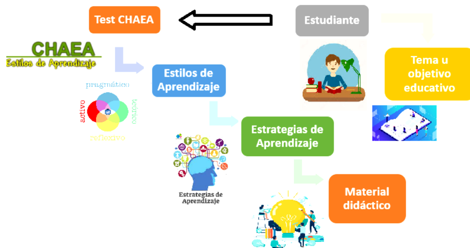
Figura 1. Proceso de diagnóstico autoría propia

Para realizar el proceso de personalización se aplica a cada estudiante la prueba CHAEA. Esta información es almacenada identificando enseguida que estilos predominan en nuestros estudiantes. Con esta información se proponen estrategias de aprendizaje y se elabora el material didáctico pertinente en cada caso de acuerdo con el tema de las asignaturas de física, química y matemáticas que se quiere reforzar.