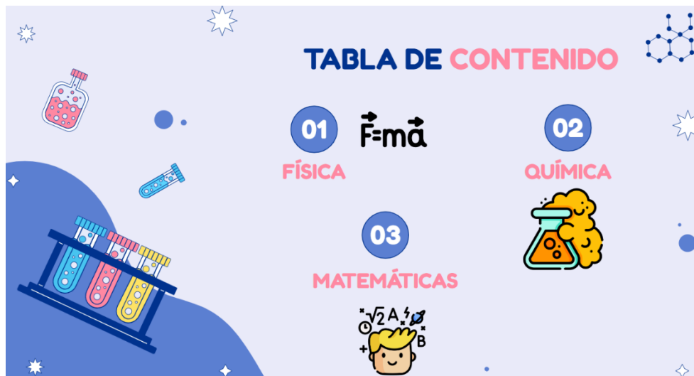
Figura 3. Resultados de la prueba CHAE de estilo de aprendizaje

https://docs.google.com/presentation/d/e/2PACX-1vTdNfLwCCRE4tQRA4vYEBt6rdSPamoW7CIX4vF_WzG7zTC2yoxkAtaKoxtBDBPRXNo_0Kcn5FesfW-l/pub?start=false&loop=false&delayms=3000